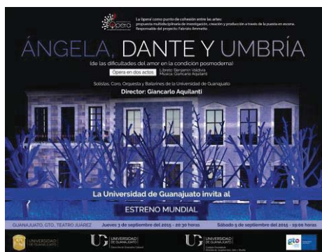
IMAGEN 3. Cartel de la ópera Ángela, Dante y Umbría